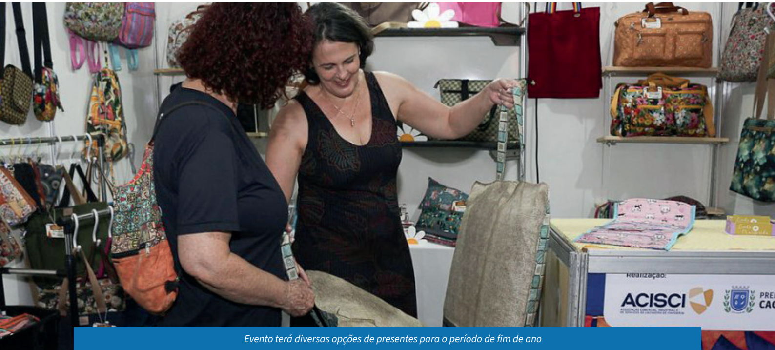
Evento terá diversas opções de presentes para o período de fim de ano