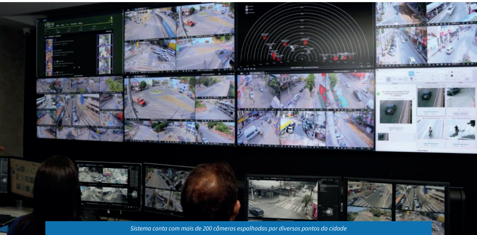
Sistema conta com mais de 200 câmeras espalhadas por diversos pontos da cidade