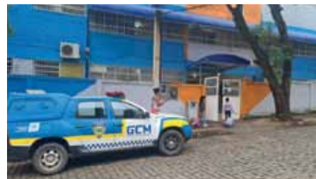
Ronda de Prevenção Escolar é uma das frentes de ação do órgão

Os cargos foram criados por meio do plano de carreira da GCM, sancionado em 2019, que estabeleceu a hierarquia da GCM, dividida em “Classe de Coordenação e Execução”, abrangendo os níveis hierárquicos de “Guarda Civil Municipal”, “Guarda Civil Municipal de Classe Distinta”; e “Classe de Comando e Supervisão”, que inclui os níveis “Guarda Civil Municipal Subinspetor” e “Guarda Civil Municipal Inspetor”.