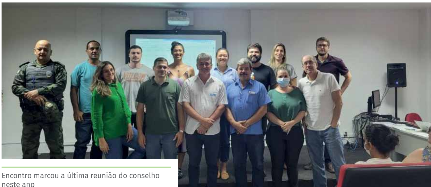
Encontro marcou a última reunião do conselho neste ano

Na última semana, o Conselho Municipal de Meio Ambiente de Cachoeiro de Itapemirim (Comamci) realizou uma reunião ordinária, marcando o encerramento de suas atividades no ano de 2022. Importante órgão de controle, o Comamci atua na fiscalização e gestão junto à Secretaria de Meio Ambiente, das ações e políticas referentes à pasta.