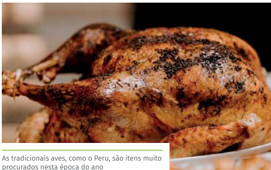
As tradicionais aves, como o Peru, são itens muito procurados nesta época do ano

Para atendimento e esclarecimentos, os consumidores podem entrar em contato com o Procon de Cachoeiro, por meio do telefone (28) 3155-5362 ou procurar atendimento presencial, na Rua Bernardo Horta, 204, Guandu. O horário de funcionamento é das 12h às 17h.