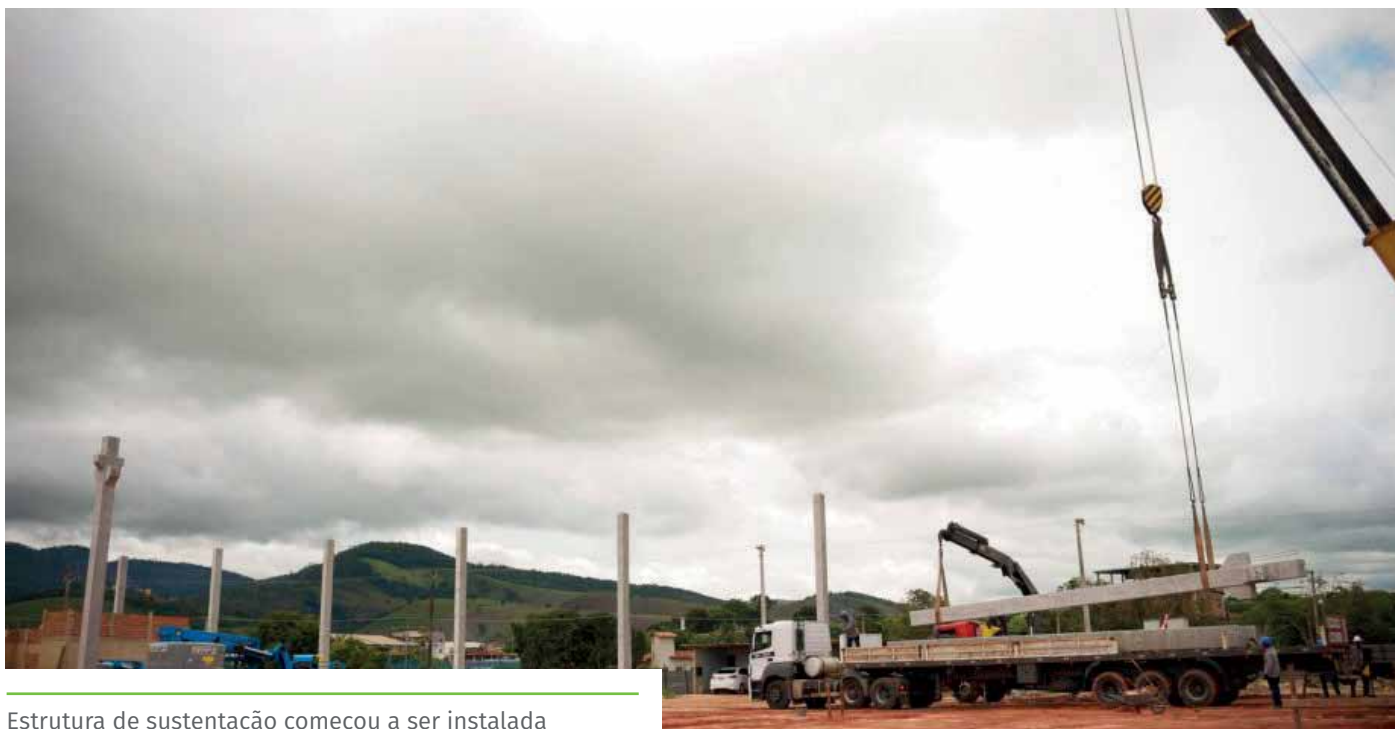
Estrutura de sustentação começou a ser instalada

As obras de construção do Centro de Eventos avançam, no Parque de Exposição “Carlos Caiado Barbosa”, situado no bairro Aeroporto. Nesta semana, a Prefeitura deu início à instalação dos trinta e cinco pilares que darão sustentação à estrutura.