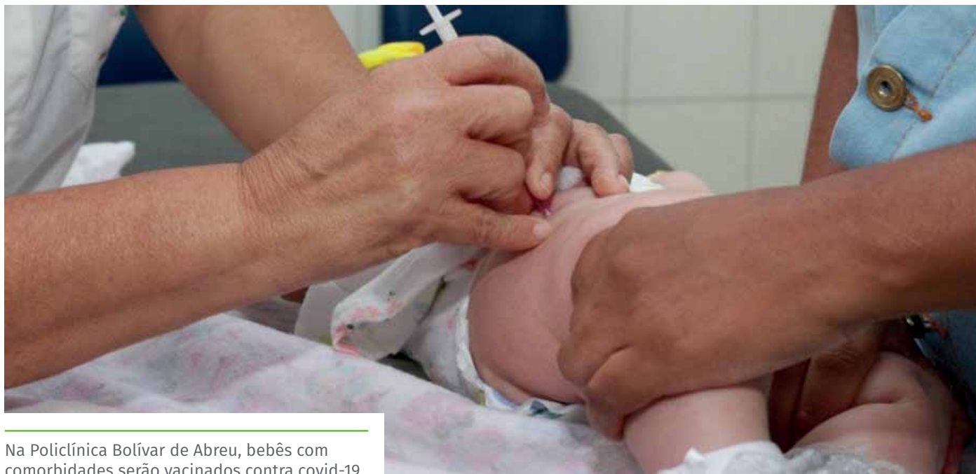
Na Policlínica Bolívar de Abreu, bebês com comorbidades serão vacinados contra covid-19

No próximo sábado (26), das 8h às 12h, tem novo Dia D de multivacinação, em Cachoeiro de Itapemirim. O foco será a atualização do cartão de vacinas para pessoas de dois meses a 14 anos, 11 meses e 29 dias; vacinação contra a covid-19, a partir de cinco anos e contra a meningite sorotipos ACWY, até 29 anos.