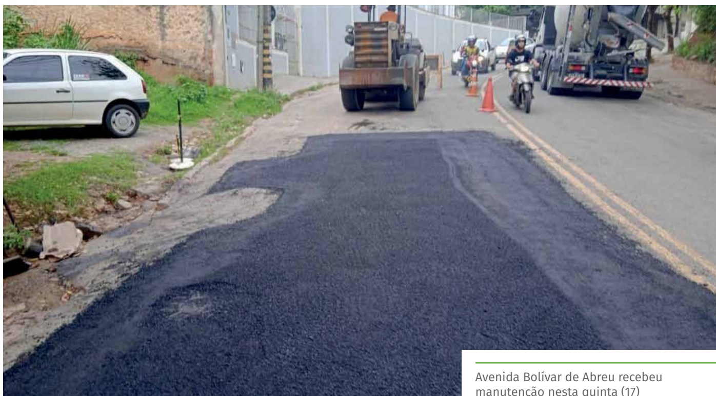
Avenida Bolívar de Abreu recebeu manutenção nesta quinta (17)

Para melhorar as condições de tráfego na avenida Bolívar de Abreu, até que as obras sejam iniciadas, a via recebeu serviços de manutenção, nesta quinta-feira.