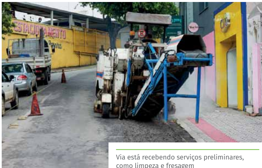
Via está recebendo serviços preliminares, como limpeza e fresagem

Até o momento, foram contempladas: as ruas Brahim Depes, José Rosa Machado, Dirceu Alves, São Cristóvão, Joana Carlete Fiorio e Domingos Alcino Dadalto; o trevo da Ilha da Luz; uma parte da rua Alzira Viana; as avenidas Fioravante Cipriano e Ubaldo Caetano Gonçalves; trechos da Linha Vermelha e das avenidas Jones dos Santos Neves, Bolívar de Abreu e Nossa Senhora da Consolação.