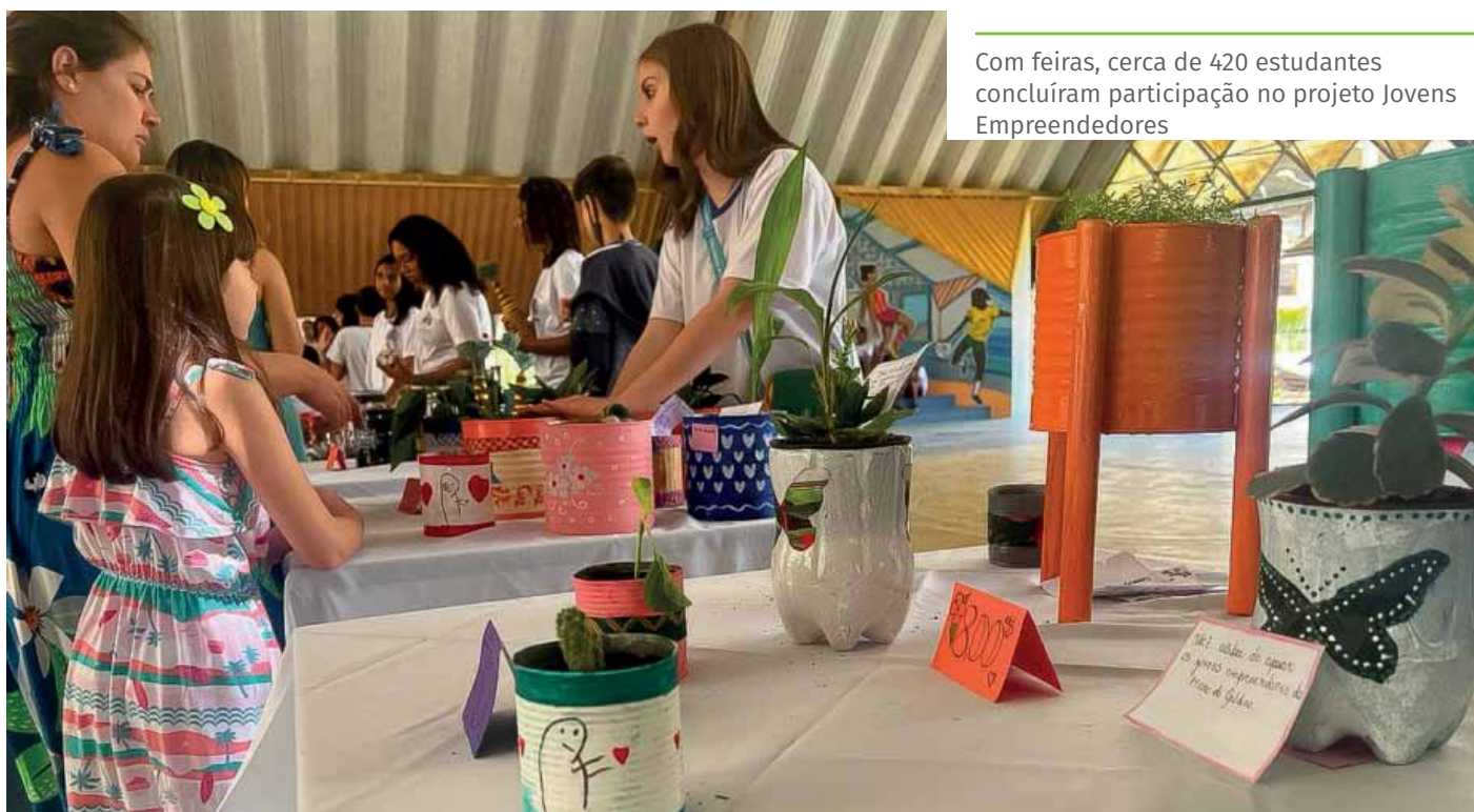
Com feiras, cerca de 420 estudantes concluíram participação no projeto Jovens Empreendedores

Planejadas em parceria com o Sebrae-ES, as ações buscam redução da burocracia para os empreendedores e incentivos ao empreendedorismo, à inovação e à geração de emprego e renda.