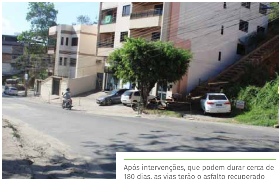
Após intervenções, que podem durar cerca de 180 dias, as vias terão o asfalto recuperado

Getúlio Vargas (Polivalente Aquidaban), a Prefeitura de Cachoeiro vai realizar uma reunião com moradores e comerciantes da região, para apresentar as etapas das obras de drenagem e repassar orientações sobre impactos no trânsito e no transporte coletivo, que também serão, amplamente, divulgadas para toda população nos próximos dias.