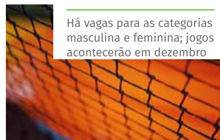
Há vagas para as categorias masculina e feminina; jogos acontecerão em dezembro

Com inscrições já encerradas, a Taça Nosso Esporte Cachoeiro também contará com competição de futsal. Mais informações sobre a realização dos jogos serão divulgadas em breve.