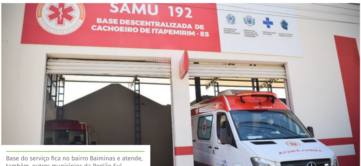
Base do serviço fica no bairro Baiminas e atende, também, outros municípios da Região Sul

IMPORTANTE: Nesses casos e em todos os casos sem caracterização de urgência ou emergência, o paciente poderá ser encaminhado ao posto de saúde ou, então, às Unidades de Pronto Atendimento (UPAs) mais próximas.