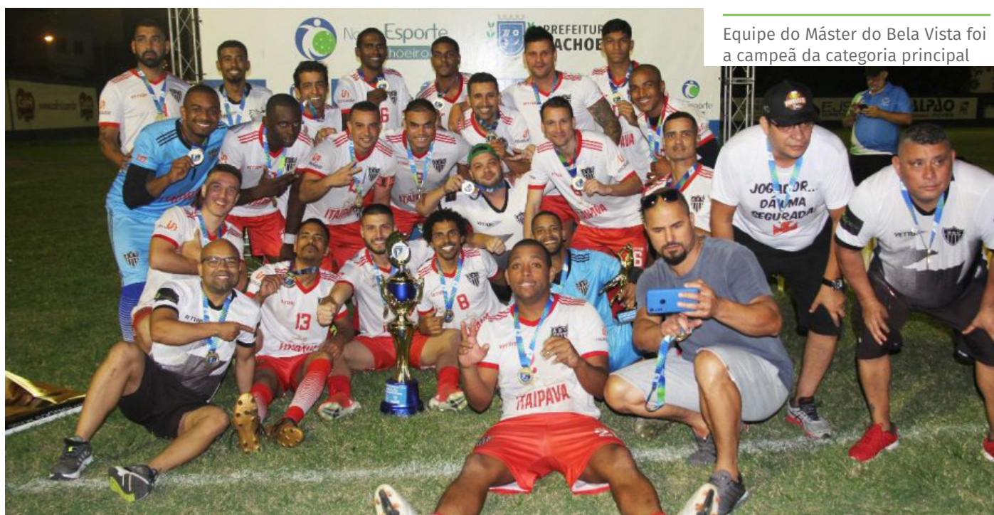
Equipe do Máster do Bela Vista foi a campeã da categoria principal