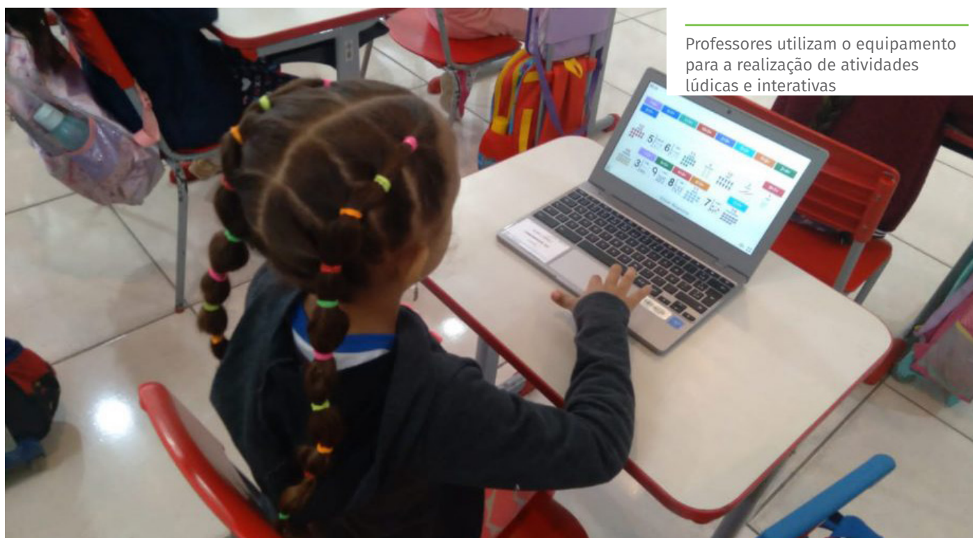
Professores utilizam o equipamento para a realização de atividades lúdicas e interativas

“A tecnologia está presente na vida de todos nós, de forma constante, e deve servir como aliada nos processos educativos. O uso desses recursos propicia a integração e democratização dos saberes e amplia as possibilidades e perspectivas de futuro de nossas crianças”, avalia o prefeito Victor Coelho.