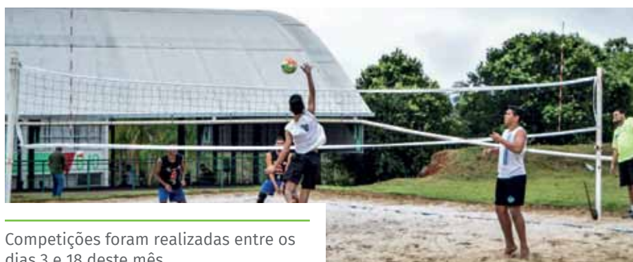
Competições foram realizadas entre os dias 3 e 18 deste mês

Confira as escolas vencedoras em cada modalidade no site www.cachoeiro.es.gov.br