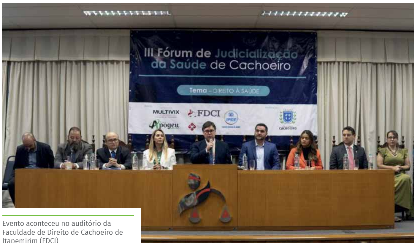
Evento aconteceu no auditório da Faculdade de Direito de Cachoeiro de Itapemirim (FDCI)

O III Fórum de Judicialização da Saúde foi uma realização da Prefeitura de Cachoeiro, com o apoio da Faculdade Multivix, Centro Universitário São Camilo, FDCI, Instituto Apogeu e Escola Técnica de Saúde.