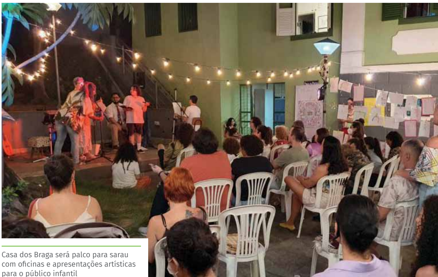
Casa dos Braga será palco para sarau com oficinas e apresentações artísticas para o público infantil

22 de outubro – sábado, 18h Casa dos Braga (rua 25 de Março, 166, Centro) Entrada gratuita