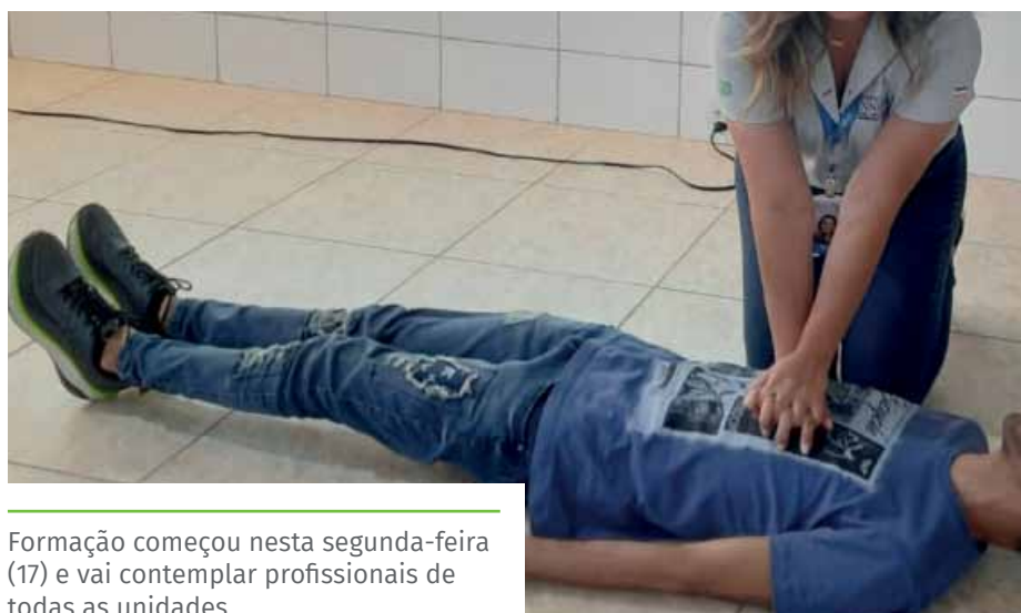
Formação começou nesta segunda-feira (17) e vai contemplar profissionais de todas as unidades