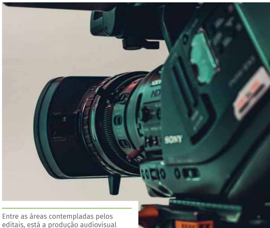
Entre as áreas contempladas pelos editais, está a produção audiovisual

O edital com as demais orientações também está disponível no site da Prefeitura de Cachoeiro ( cachoeiro.es.gov.br/editais ). Dúvidas podem ser sanadas por meio do telefone 28 3155-5334, da Gerência de Eventos e Patrimônio Imaterial da Semcult.