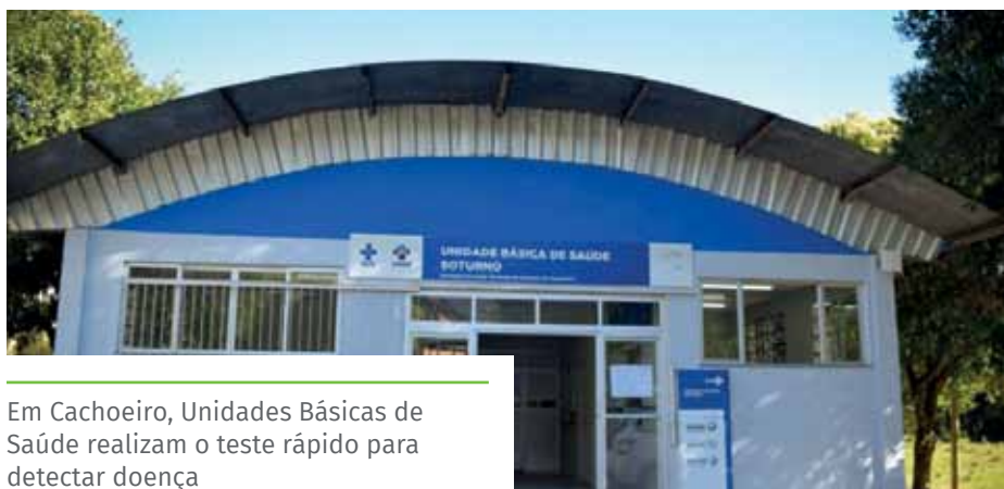
Em Cachoeiro, Unidades Básicas de Saúde realizam o teste rápido para detectar doença

Os sinais e sintomas aparecem entre seis semanas e seis meses do aparecimento e cicatrização da ferida inicial. Podem ocorrer manchas no corpo, que geralmente não coçam, incluindo palmas das mãos e plantas dos pés. Essas lesões são ricas em bactérias. Os principais sintomas incluem, ainda, febre, mal-estar, dor de cabeça e ínguas pelo corpo.