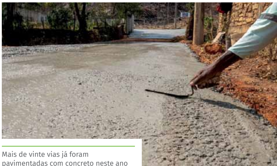
Mais de vinte vias já foram pavimentadas com concreto neste ano

Coramara, São Luiz Gonzaga, Marbrasa, São Francisco de Assis, Gilberto Machado, Parque Laranjeiras, Novo Parque, Boa Vista, Vila Rica e nos distritos de Soturno, Gironda e Itaoca.