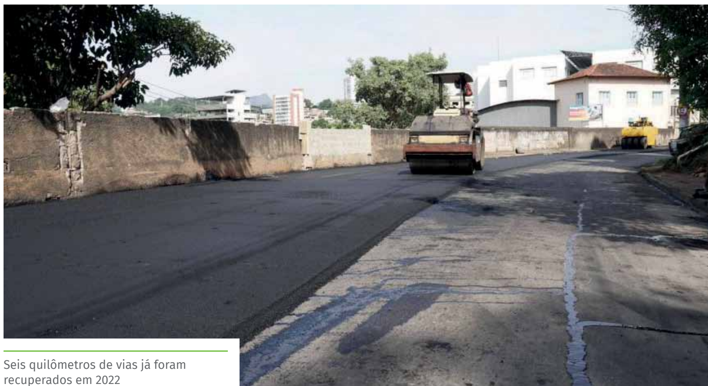
Seis quilômetros de vias já foram recuperados em 2022

Até o momento, foram contempladas: as ruas Brahim Depes, José Rosa Machado, Joana Carlete Fiorio e Domingos Alcino Dadalto e uma parte da rua Alziro Viana, além das avenidas Fioravante Cipriano, Ubaldo Caetano Gonçalves e um trecho da Linha Vermelha e das avenidas Jones dos Santos Neves e Bolívar de Abreu. Em extensão, já são 6 quilômetros recuperados, dos 12 previstos na primeira fase do programa.