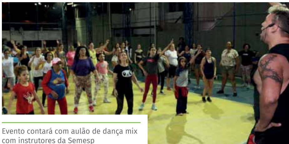
Evento contará com aulão de dança mix com instrutores da Semesp

inauguração, basta comparecer. Para maior bem-estar durante as atividades físicas, a Semesp recomenda que os presentes estejam trajados com roupas leves e confortáveis. Além disso, é importante levar uma garrafa de água para hidratação.