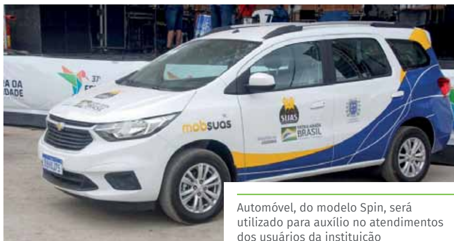
Automóvel, do modelo Spin, será utilizado para auxílio no atendimentos dos usuários da instituição

Chamado PediaSuit, o tratamento beneficia pacientes com funções motoras comprometidas, como paralisia cerebral, atraso no desenvolvimento, lesões traumáticas cerebrais, entre outros. O programa, intensivo e individual, visa o ganho de força, funcionalidade, coordenação e equilíbrio.