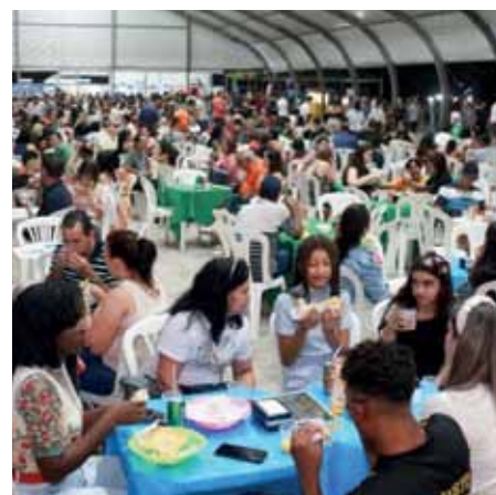
Público marcou presença no Parque de Exposição do Aeroporto

Ao todo, foram arrecadados 1.062,3 quilos de donativos, que serão destinados ao Banco de Alimentos, responsável por distribuir cestas de alimentos a famílias em vulnerabilidade social e a organizações de assistência social.