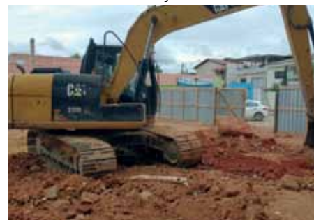
Terrenos estão recebendo serviço de terraplanagem

do Estado, a Prefeitura está construindo campos de futebol society nos bairros Rubem Braga e Jardim Itapemirim. No bairro Nossa Senhora Aparecida, em terreno cedido pela Prefeitura, a Secretaria Estadual de Esporte constrói uma unidade da Praça Saudável.