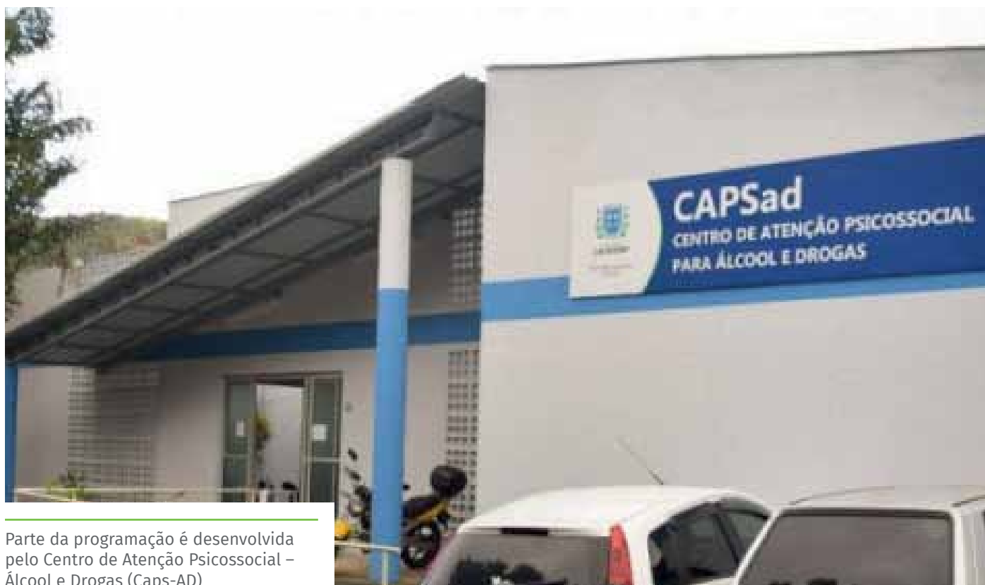
Parte da programação é desenvolvida pelo Centro de Atenção Psicossocial – Álcool e Drogas (Caps-AD)