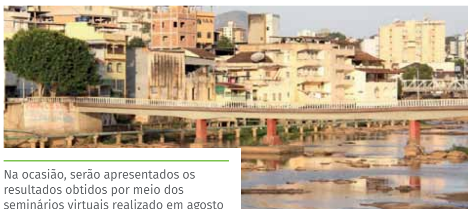
Na ocasião, serão apresentados os resultados obtidos por meio dos seminários virtuais realizado em agosto

Para facilitar o acesso aos documentos gerados em cada etapa do PMD, a Secretaria Municipal de Meio Ambiente os disponibiliza em sua página no site www.cachoeiro.es.gov.br .