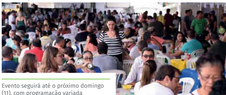
Evento seguirá até o próximo domingo (11), com programação variada