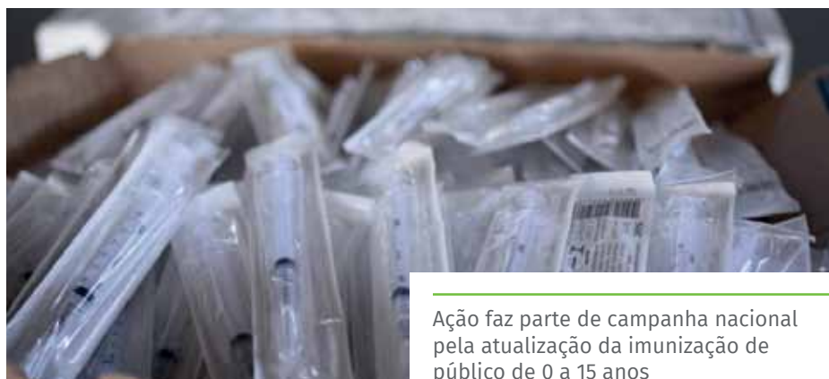
Ação faz parte de campanha nacional pela atualização da imunização de público de 0 a 15 anos

Veja os pontos de vacinação no Dia D da multivacinação no site: https://www.cachoeiro.es.gov.br