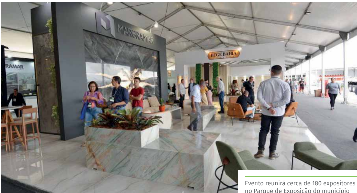
Evento reunirá cerca de 180 expositores no Parque de Exposição do município

Mais informações sobre o evento: www.cachoeirostonefair.com.br .