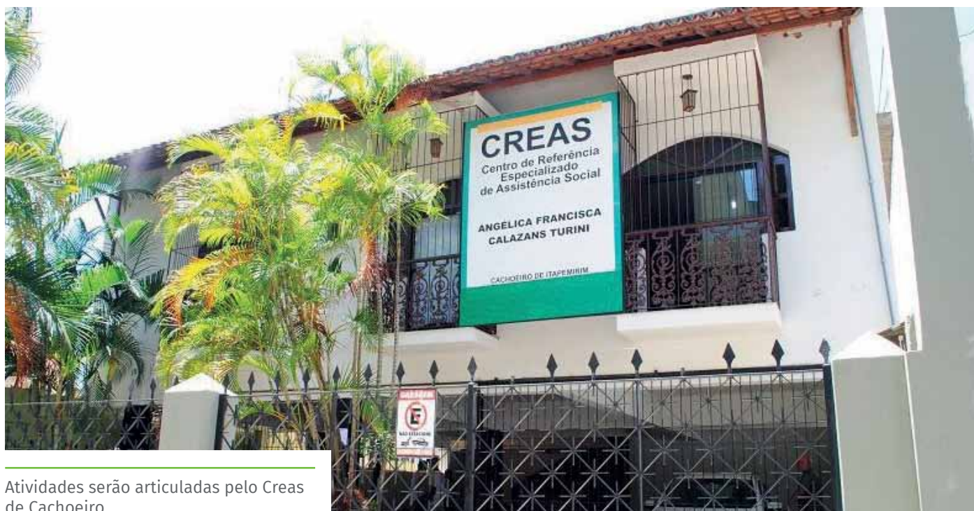
Atividades serão articuladas pelo Creas de Cachoeiro

Especializada de Atendimento à Mulher de Cachoeiro.