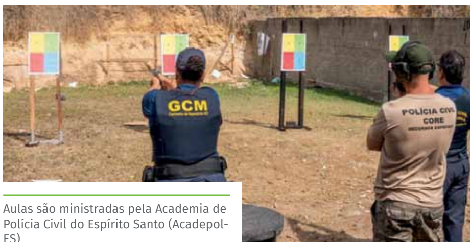
Aulas são ministradas pela Academia de Polícia Civil do Espírito Santo (Acadepol-ES)

Na última semana, a frota da Guarda Civil Municipal foi ampliada com duas novas viaturas. Doadas pelo governo estadual, os veículos Renault Duster vão fortalecer o patrulhamento preventivo feito pela corporação.