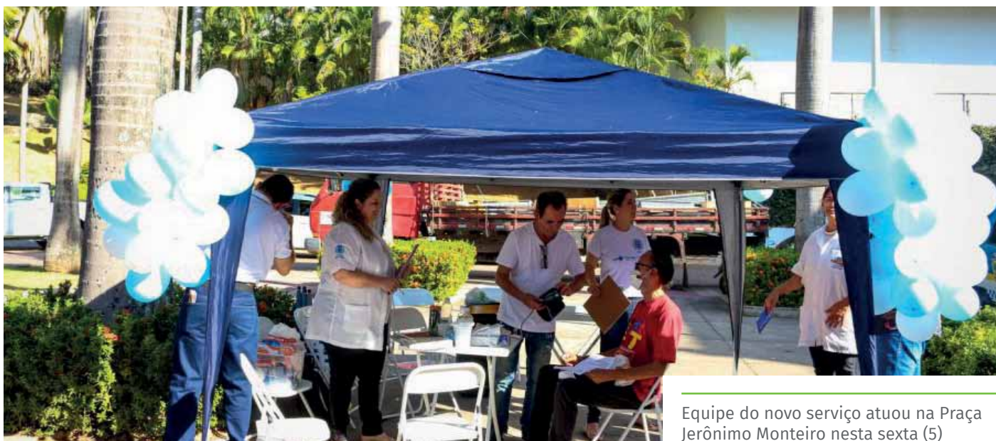
Equipe do novo serviço atuou na Praça Jerônimo Monteiro nesta sexta (5)

Em Cachoeiro, a equipe do Consultório está lotada na Unidade Básica Saúde do bairro Aquidaban, por apresentar localização central, oferecendo maior acessibilidade aos pacientes.