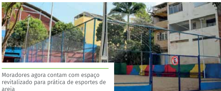
Moradores agora contam com espaço revitalizado para prática de esportes de areia

Neste ano, a Prefeitura de Cachoeiro também já entregou as reformas das quadras poliesportivas dos bairros Caiçara, Basileia, IBC e Paraíso. Além disso, está investindo em novos espaços esportivos. Estão em andamento obras de construção de campos de futebol society nos bairros Rubem Braga e Jardim Itapemirim e no distrito de Conduru, além do Centro de Treinamento de Lutas, no ginásio do Rubem Braga. Na última semana, foi autorizado o início da construção da quadra de Salgadinho, em Soturno.