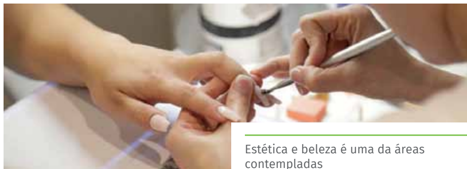
Estética e beleza é uma das áreas contempladas

Mais informações sobre os cursos podem ser obtidas pelo telefone (28) 3522-5612.