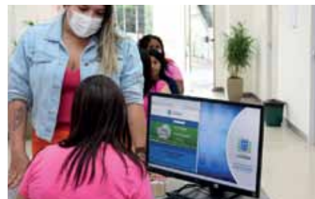
Espaço foi aberto ao público feminino nesta segunda-feira (1)