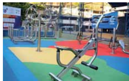
Área de esporte e lazer está repaginada e tem novos atrativos

A partir de convênio com o governo estadual, foram iniciadas, recentemente, as obras de construção de outros três novos espaços esportivos: os campos de futebol society dos bairros Rubem Braga e Jardim Itapemirim e a Praça Saudável do Nossa Senhora Aparecida. Em parceria com o governo federal, começaram, neste mês, as obras do Centro de Treinamento de Lutas, também no Rubem Braga.