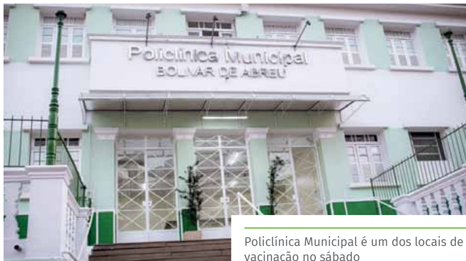
Policlínica Municipal é um dos locais de vacinação no sábado

Vacina contra a Covid-19 – A vacina contra Covid-19 é ofertada ao público a partir dos 3 anos de idade. A terceira dose (primeira dose de reforço) pode ser tomada pelo público acima dos 12 anos, e a segunda dose de reforço (quarta dose), pelo público acima dos 18 anos.