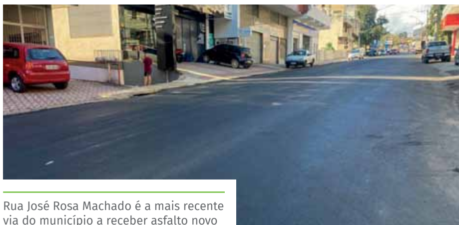
Rua José Rosa Machado é a mais recente via do município a receber asfalto novo

“Estamos seguindo com a primeira fase do nosso programa de recuperação asfáltica, fruto de mais uma importante parceria com o Governo do Estado, com investimento de quase R$ 12 milhões em melhorias em importantes vias do município, gerando mais tranquilidade e segurança aos condutores. Na segunda fase, serão investidos mais R$ 30 milhões, para contemplarmos diversas outras vias”, destaca o prefeito Victor Coelho.