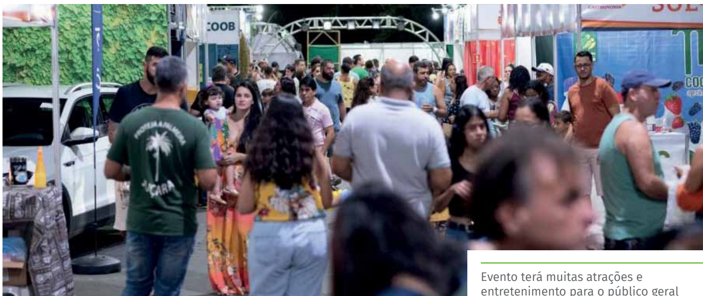
Evento terá muitas atrações e entretenimento para o público geral

“A edição 2022 marca o retorno da Exposul ao Parque de Exposições, após um intervalo de inviabilidade, em função da pandemia. Nesse período, realizamos edições setoriais e menores da feira. Agora, queremos fazer um evento maior, retomando, aos poucos, o porte que tinha na fase pré-pandemia”, afirma o prefeito de Cachoeiro, Víctor Coelho.