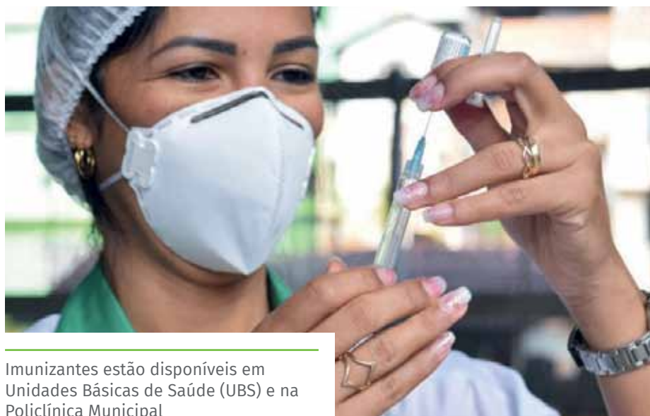
Imunizantes estão disponíveis em Unidades Básicas de Saúde (UBS) e na Policlínica Municipal

O imunizante pode ser encontrado em todas as salas de vacinação do município, com esquema vacinal de três doses.