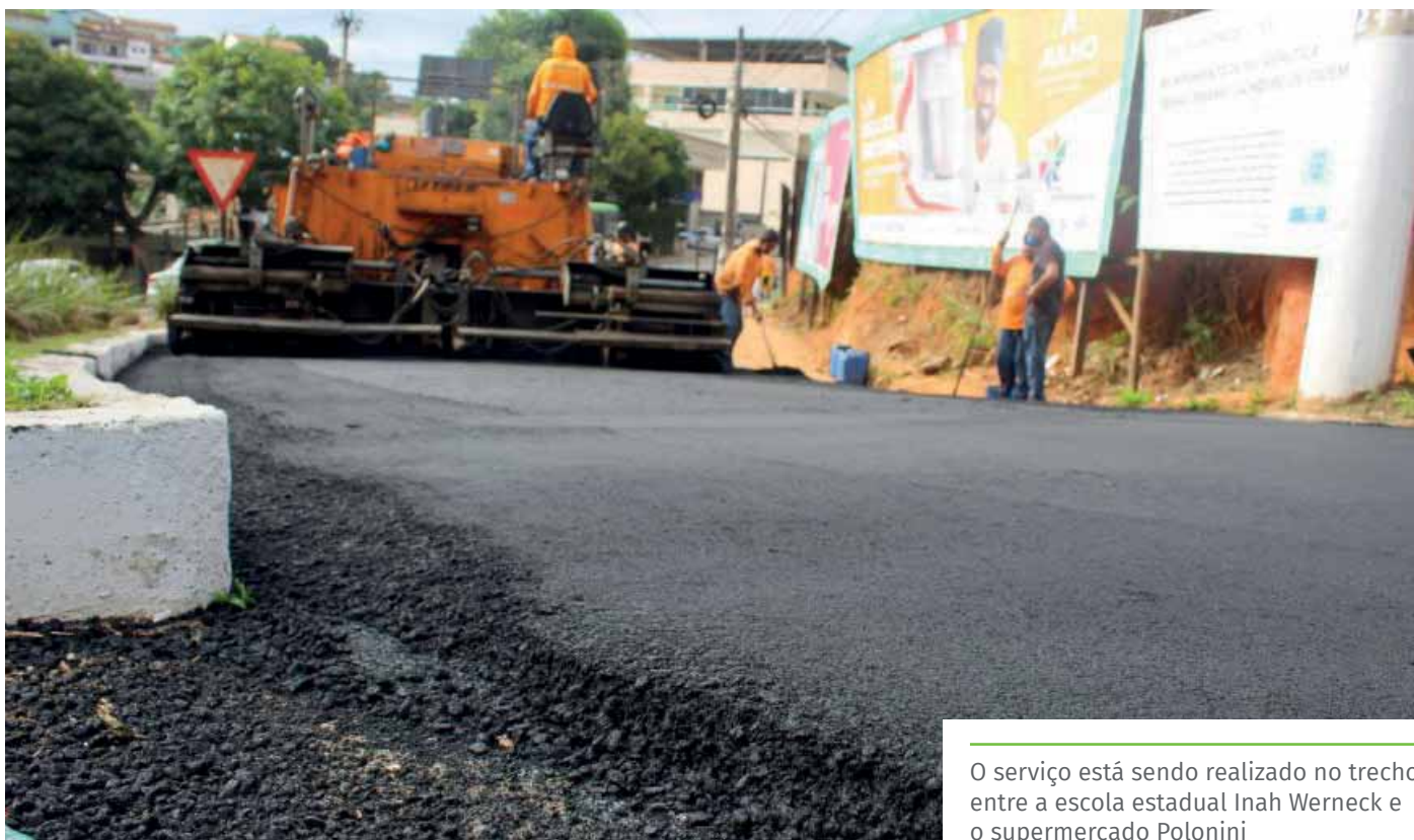
O serviço está sendo realizado no trecho entre a escola estadual Inah Werneck e o supermercado Polonini

As obras, que contam com investimentos do Governo do Estado do Espírito Santo, são realizadas por uma empresa contratada pela Prefeitura de Cachoeiro, via processo licitatório.