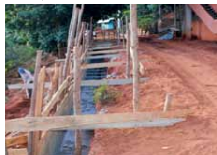
Muro de contenção está sendo construído na rua Wilson Duarte

Nesta quinta-feira (7), a Prefeitura autorizará o início da reforma e modernização do ginásio na orla do Rubem Braga, para implantação do Centro de Treinamento de Lutas do município.