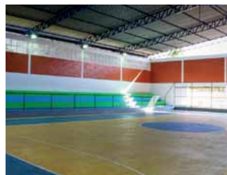
Renovado, espaço abrigará centro de treinamento de esportes adaptados para pessoas com deficiência

Além disso, também foram entregues itens que serão direcionados aos núcleos esportivos do bairro, como colchonetes, bambolês, bolas e cordas.