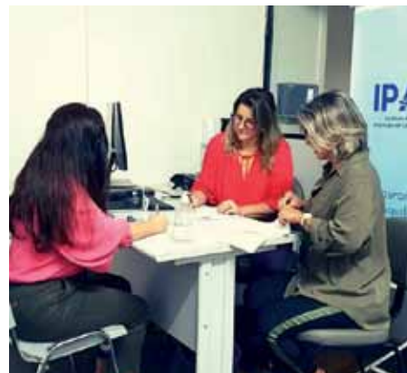
Inscrições de candidatos serão feitas até sexta (8), na sede do instituto

membros do Conselho Deliberativo do órgão, pode ser acompanhado pelo endereço www.ipaci.es.gov.br/eleicao-online .