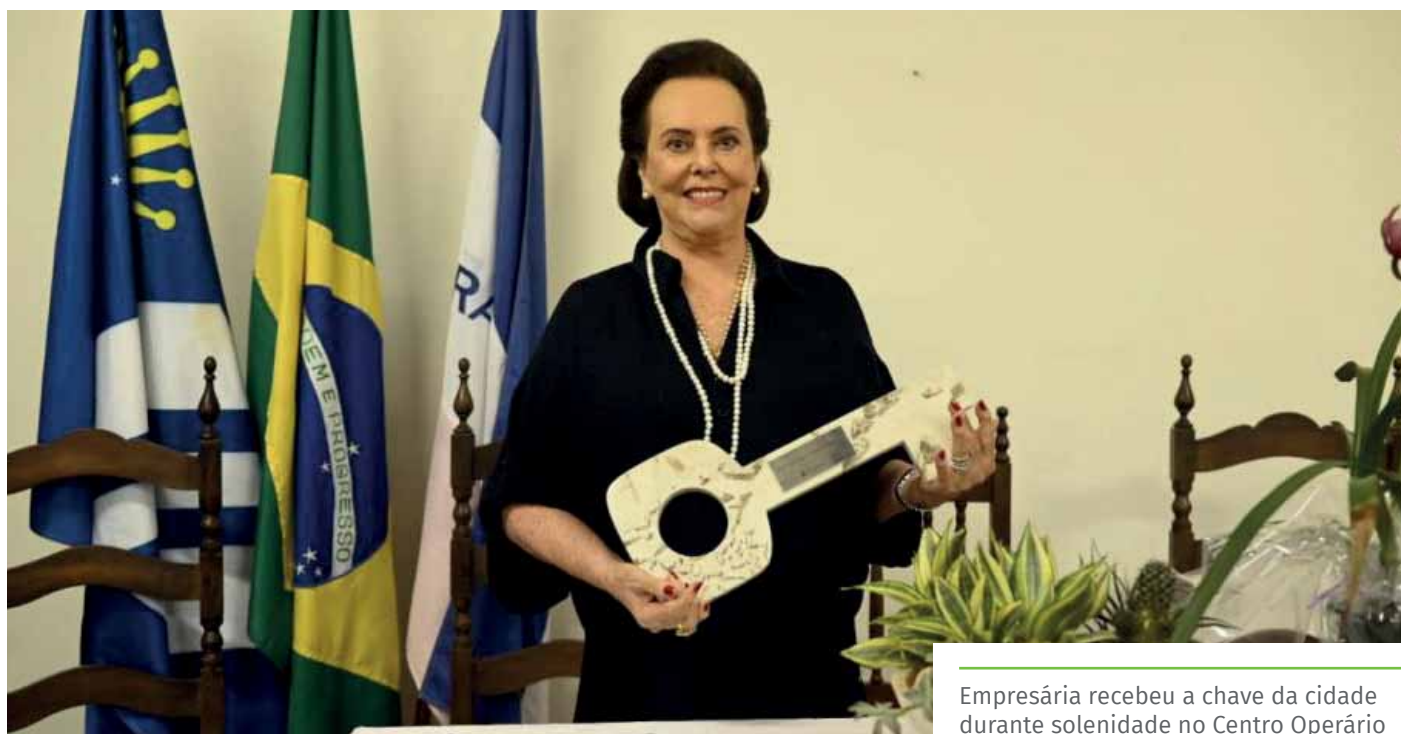
Empresária recebeu a chave da cidade durante solenidade no Centro Operário