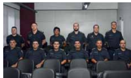
Guardas promovidos passaram por uma seleção, com teste de aptidão física e avaliação de outros requisitos

é uma conquista para Cachoeiro, para a segurança do cachoeirense. E são expressivas as conquistas dos últimos anos: conseguimos o rearmamento dos guardas; investimos em novos equipamentos e em capacitação; instituímos um novo plano de carreira, que se destaca no Espírito Santo; ampliamos e modernizamos o sistema de videomonitoramento. Estamos construindo um novo Centro de Operações e seguiremos apostando na melhoria e na evolução contínua da GCM”, salientou o prefeito.