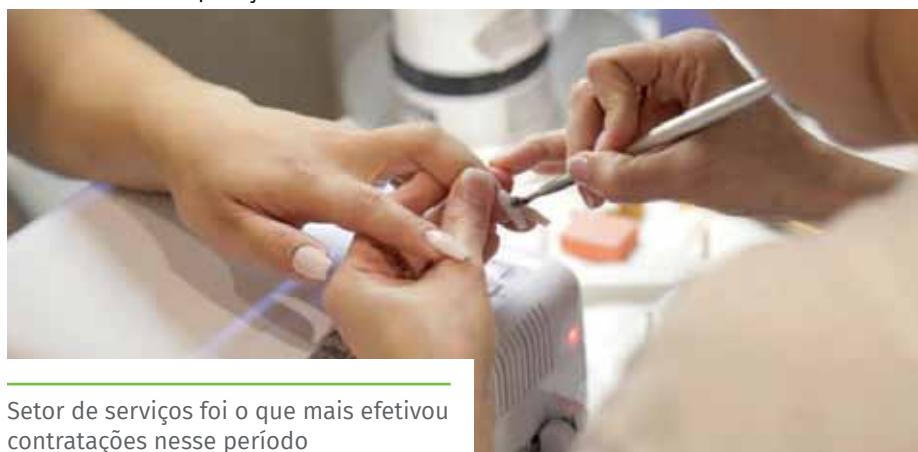
Setor de serviços foi o que mais efetivou contratações nesse período

“Cachoeiro é o maior centro econômico do sul do Espírito Santo e a atual gestão não tem medido esforços para apoiar o empreendedorismo, melhorar o ambiente de negócios e incentivar investimentos que ajudam a gerar mais empregos”, destaca.