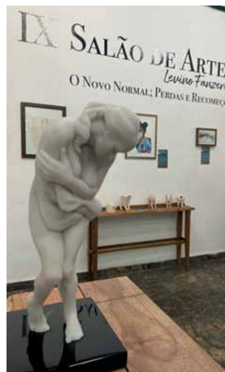
Público pode conferir trabalhos de artistas de diferentes regiões do país

Até 6 de julho – segunda a sexta, das 9h às 18h