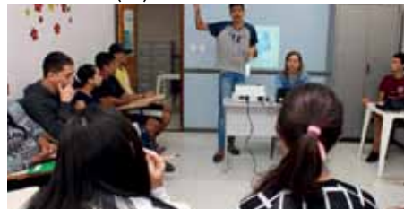
Participantes também recebem orientações sobre mercado de trabalho

Terça-feira (14 de junho) — Cras Burarama – 14h Endereço: Rodovia João Zago, s/n – Burarama Telefone: (28) 3539-3014 Quinta-feira (15 de junho) — Cras Zumbi – 14h Endereço: Rua Maria Dolores Santana, 281-395 – Zumbi Telefone: (28) 3526-7880 Sexta-feira (1 de julho) — Cras Jardim Itapemirim – 9h Endereço: Rua Aryo Sardemberg, 1 – Jardim Itapemirim Telefone: (28) 3155-5329