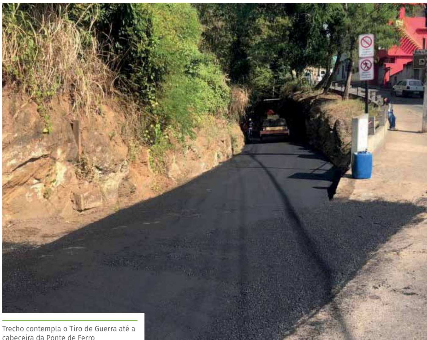
Trecho contempla o Tiro de Guerra até a cabeceira da Ponte de Ferro

As obras fazem parte de um programa de recuperação de ruas e avenidas do município. Já foram contempladas as ruas Joana Carlete Fiorio e Domingos Alcino Dadalto, além da avenida Fioravante Cipriano e um trecho da Linha Vermelha e da avenida Jones dos Santos Neves. As obras contam com investimentos do Governo do Estado do Espírito Santo.