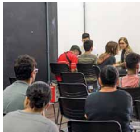
Primeiro Cras a receber a ação foi o do Aeroporto, nesta segunda (6)

Telefone: (28) 3526-7880 Sexta-feira (1 de julho) — Cras Jardim Itapemirim – 9h Endereço: Rua Aryo Sardemberg, 1 – Jardim Itapemirim Telefone: (28) 3155-5329