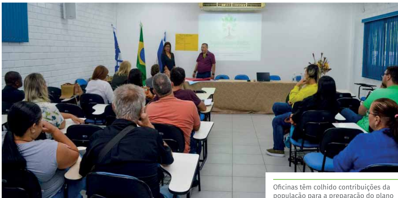
Oficinas têm colhido contribuições da população para a preparação do plano