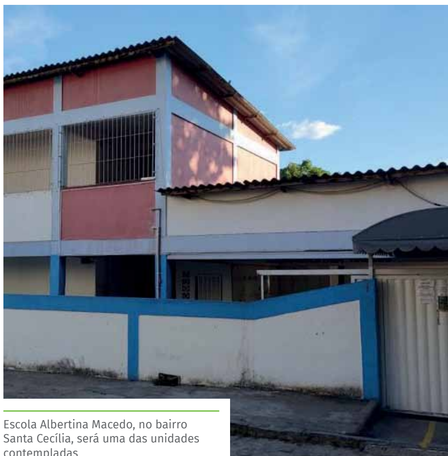
Escola Albertina Macedo, no bairro Santa Cecília, será uma das unidades contempladas

Além disso, também em abril, foi assinada a ordem de serviço para a reforma da escola municipal “Anacleto Ramos” e anunciada a reforma e ampliação da escola Zilma Coelho Pinto, ambas no bairro Ferroviários.