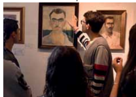
A atividade da Bienal Rubem Braga é direcionada para grupos e escolas

A atividade vai ser realizada até sexta-feira (27) e é direcionada para grupos e escolas. Os interessados devem agendar o passeio pelo telefone (28) 3155-5342. O agendamento está aberto para instituições privadas e públicas de Cachoeiro e de municípios vizinhos.