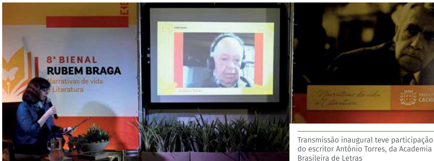
Transmissão inaugural teve participação do escritor Antônio Torres, da Academia Brasileira de Letras

Além das mesas de debates e de lançamento de livros, a programação conta, ainda, com atividades em escolas; exposições em centros culturais; city tour dedicado ao cronista e uma feira de artesanato. Confira a programação completa do evento no site www.cachoeiro.es.gov.br .