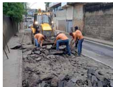
Obra será executada no trecho entre o Fórum e o Tiro de Guerra