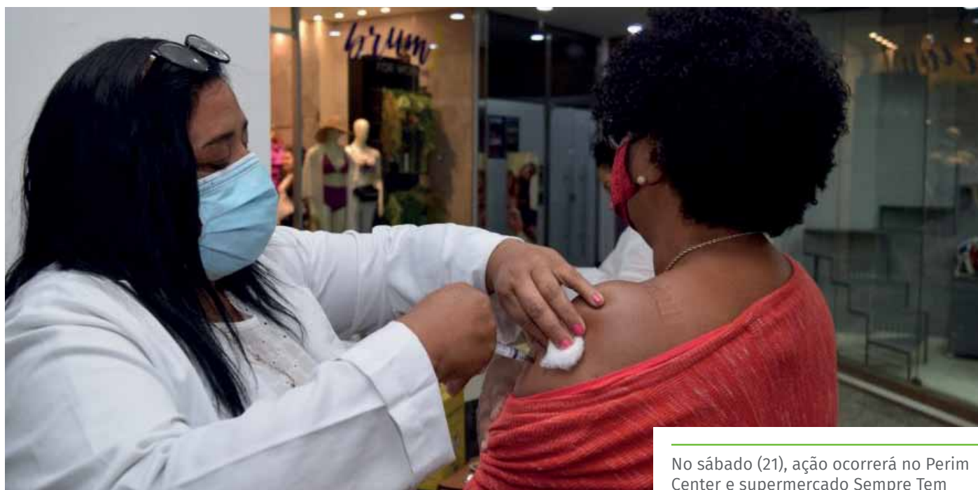
No sábado (21), ação ocorrerá no Perim Center e supermercado Sempre Tem

UBS Aquidaban UBS Aeroporto UBS IBC UBS Novo Parque UBS Abelardo Machado UBS Gilson Carone UBS Village da Luz UBS Amaral UBS Alto União UBS São Luiz Gonzaga UBS BNH de Baixo UBS BNH de Cima UBS Zumbi UBS Paraíso UBS Coramara UBS Nossa Senhora Aparecida UBS Elpidio Volpini UBS Otton Marins Interior UBS Soturno UBS Burarama UBS Pacotuba UBS Córrego dos Monos UBS Itaoca UBS Conduru