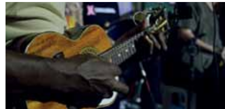
Músicos se apresentarão no Circo da Cultura, com entrada franca

A primeira apresentação ocorreu no dia 6 de maio, com grupo de seresta liderado pelo músico Edgar Pinheiro. Participam da iniciativa artistas selecionados via edital de credenciamento (Semcult 004/2021).