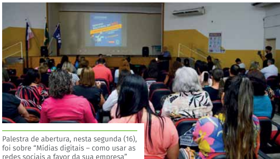
Palestra de abertura, nesta segunda (16), foi sobre “Mídias digitais – como usar as redes sociais a favor da sua empresa”