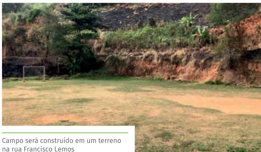
Campo será construído em um terreno na rua Francisco Lemos

Os itens, entregues por meio do Programa Campeões do Futuro, do Governo do Estado, incluem: bolas, redes, pratos demarcatórios, cones, apitos, cronômetros digitais, bombas, bico e agulhas, calibradores digitais, arcos, bolas, fitas, maçãs, sapatilhas, estiletes, cordas, hidro tubo, flutuador, pranchas, toucas, óculos, apito, cronômetros digitais, tatames, protetor de tórax, aparador de chutes e quimonos. A expectativa é de beneficiar até 500 crianças e adolescentes.