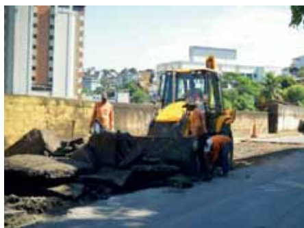
Ação faz parte do programa de recuperação de vias do município

Iniciados na última segunda-feira (9), os serviços estão previstos para