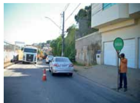
Trânsito no local está funcionando no sistema pare e siga