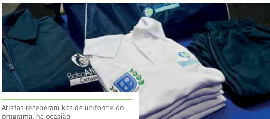
Atletas receberam kits de uniforme do programa, na ocasião