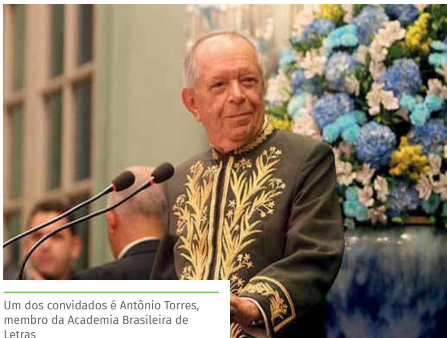
Um dos convidados é Antônio Torres, membro da Academia Brasileira de Letras

https://www.cachoeiro.es.gov.br/noticias/bienal-rubem-braga-2022-tera-participacao-de-autores-renomados/