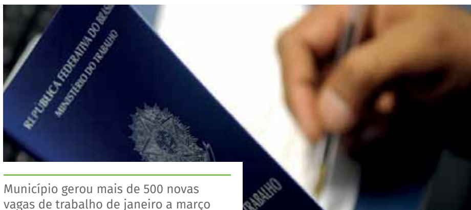
Município gerou mais de 500 novas vagas de trabalho de janeiro a março

atividades de forma plena. Cachoeiro é o maior polo econômico do sul do Espírito Santo, e nossa gestão tem se empenhado, cada vez mais, em melhorar o ambiente de negócios, facilitar o empreendedorismo e trazer o empresariado e os investidores para o município, para gerar mais empregos e renda”, destaca.