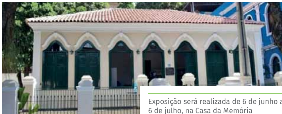
Exposição será realizada de 6 de junho a 6 de julho, na Casa da Memória