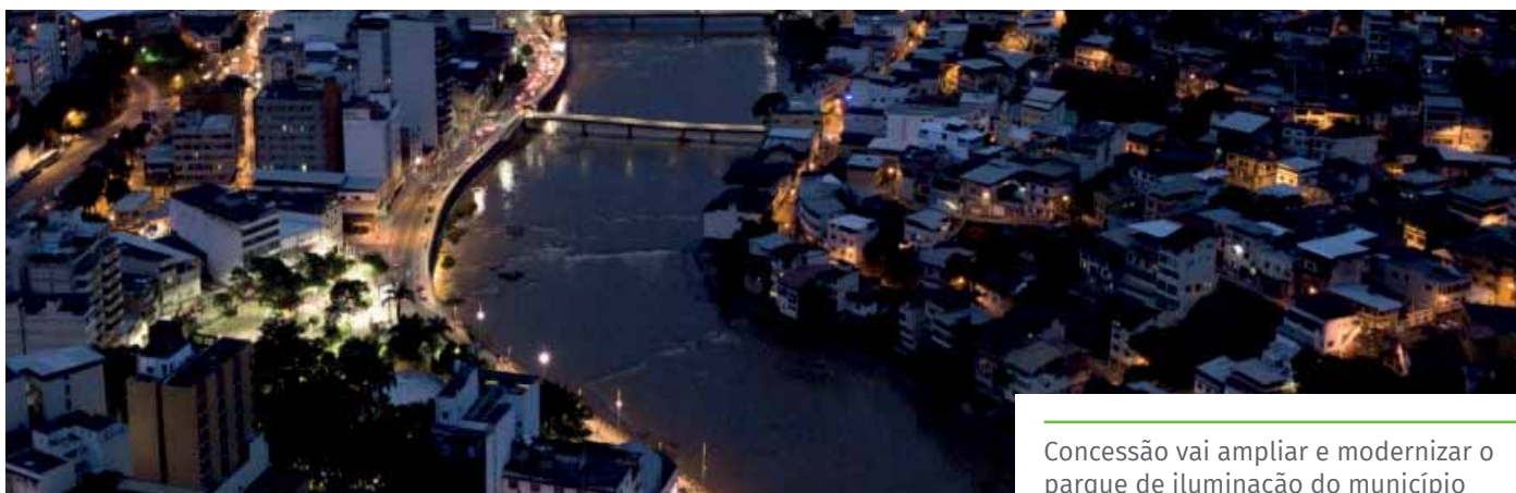
Concessão vai ampliar e modernizar o parque de iluminação do município