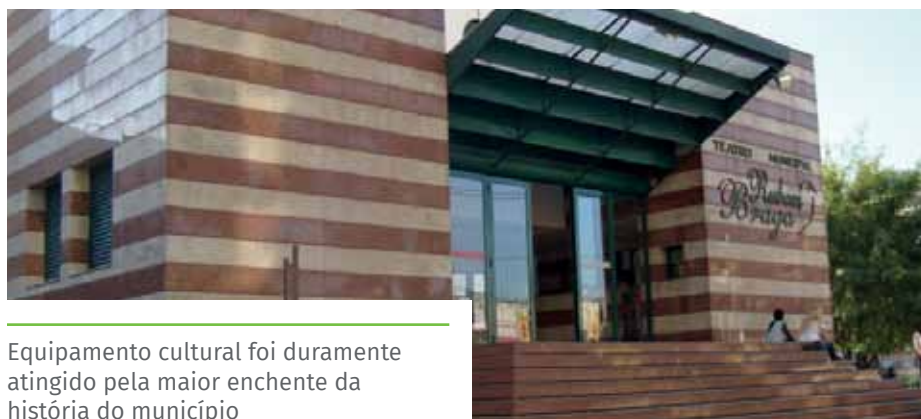
Equipamento cultural foi duramente atingido pela maior enchente da história do município

Nos próximos meses, o Museu Ferroviário Domigos Lage e o Centro Cultural Mestre Salatiel receberão obras de manutenção.