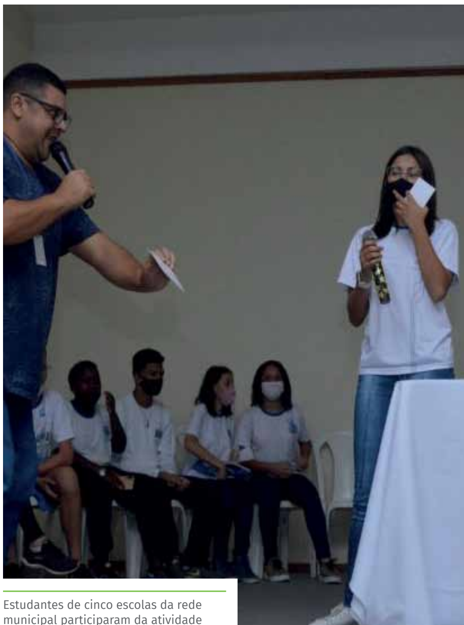
Estudantes de cinco escolas da rede municipal participaram da atividade

Além disso, a programação contou, também, com a realização do Miss Jovem Guarda 2022 e do concurso de fãs “Minha História com o Rei”.