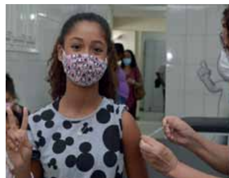
Ação teve como foco principal vacinar crianças de 5 a 11 anos

No risco muito baixo, as medidas aplicadas às demais classificações de risco (extremo, alto, moderado, baixo) serão extintas. Com isso, não haverá mais necessidade de aplicação das medidas restritivas em sua quase totalidade.