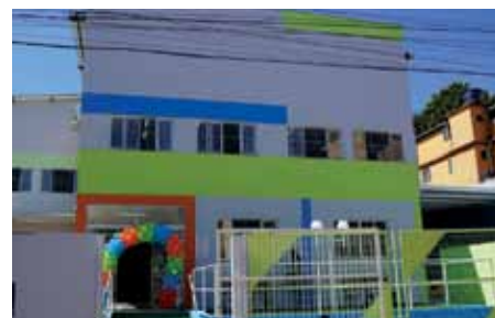
Com melhorias, unidade vai ampliar o número de alunos que atende

O investimento total nas melhorias estruturais da escola foi de R$1.293.840,85. A partir da próxima segunda-feira (21), os alunos de 0 a 5 anos já iniciam as aulas no prédio inaugurado.