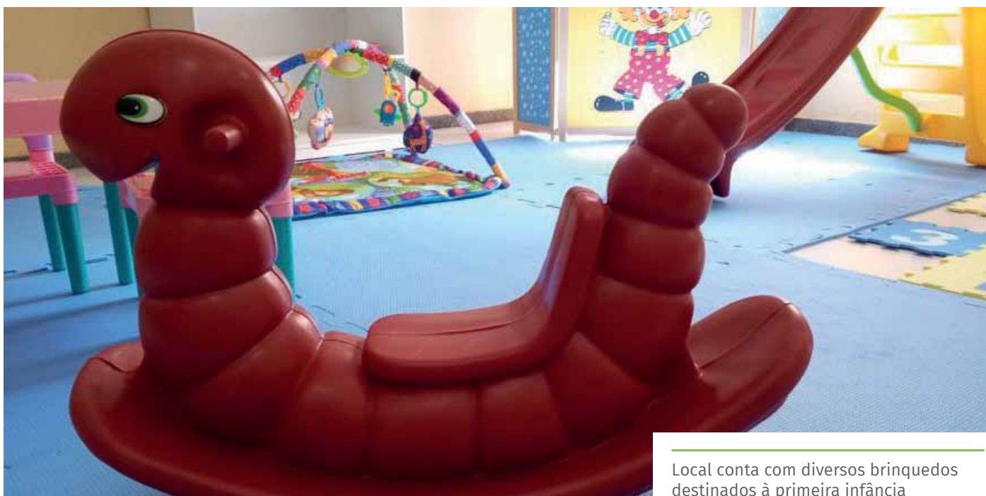
Local conta com diversos brinquedos destinados à primeira infância

A principal ação do programa é a realização de atendimentos domiciliares, com ações presenciais e remotas, atuando sob as perspectivas da prevenção, proteção e promoção do desenvolvimento infantil.